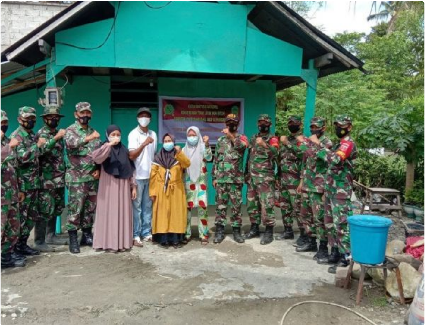
Karya Bakti Rehab RTLH Koramil 1403-14 Mangkutana Semester I TA 2021

LUWU TIMUR - Personel Koramil 14/Mangkutana jajaran Kodim 1403/PLP secara keseluruhan telah rampung melaksanakan kegiatan Karya Bakti dengan sasaran Rumah Tidak Layak Huni yang bertemakan " Karya Bhakti TNI pengabdian untuk negeri" Semester I TA 2021.